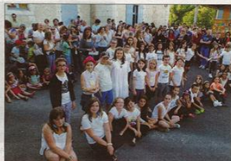
Pour la fête de fin d'année, les élèves de CE2, CM1 et CM2 avaient préparé plusieurs chansons.