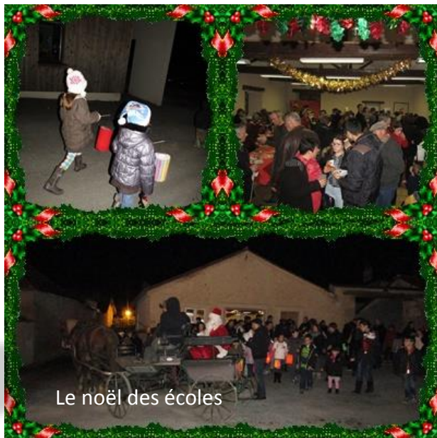
Le Noël des écoles